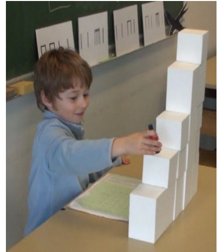
La (sur la table) do ré mi sol la

Le Solmiplot est ici en assemblage pentatonique :