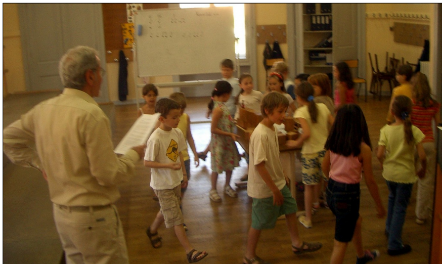
A la Maîtrise de l'Opéra de Lyon, le 12 juin 2006