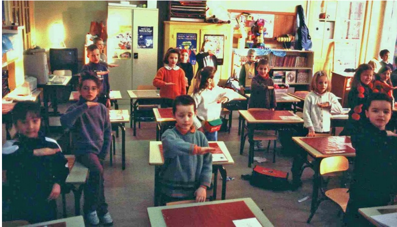
"Dictée" de relations mélodiques, en phonomimie et sur le Solmiplot

Le Solmiplot est ici en assemblage pentatonique :